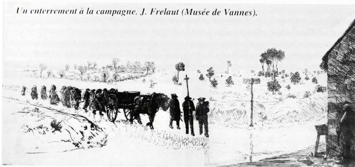
Extrait de "Labourerien an douar hag ar mor" - Pouldergat-Pouldavid - Amzer gwechall - 1999

Je soussigné, certifie avoir lu et examiné le présent état dans lequel je n'ai rien trouvé que de vrai, en foi de quoi j'ai signé, ce jour trente octobre mil sept cent cinquante-huit.