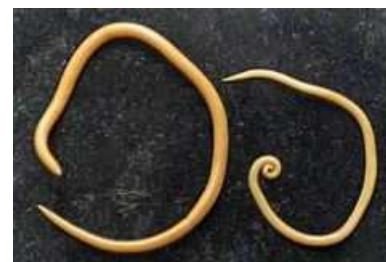
Ascaris femelle et mâle

L'ascaris est helminthe nématode de grande taille 20 cm de long pour un diamètre de 5 mm. La contamination se faisant par voie digestive par ingestion d'eau ou d'aliments contaminés. La maladie peu grave entraîne un affaiblissement de l'organisme avec dénutrition favorisant d'autres pathologies. La femelle ascaris pond 200.000 œufs par jour, dispersés par les selles. Les œufs fécondés ingérés évoluent en embryons, devenant infectieux dans les semaines suivantes au sein de l'intestin, puis ils sont transportés par la veine porte et la circulation sanguine et gagnent le poumon où les larves viennent à maturation. Elles peuvent remonter l'arbre bronchique et parvenir jusqu'à la gorge où elles sont avalées. Il s'agit d'un cycle direct à un seul hôte : l'homme. L'auto-réinfestation est impossible, puisque les œufs d'ascaris émis dans les selles ne contiennent pas d'embryons. Dans l'ascaridiose, les embryons n'apparaissent qu'après développement des œufs dans le milieu extérieur.