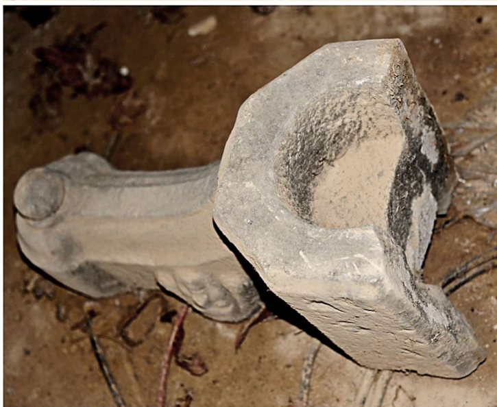
Le débris de calvaire à Kerhomen en septembre 2025