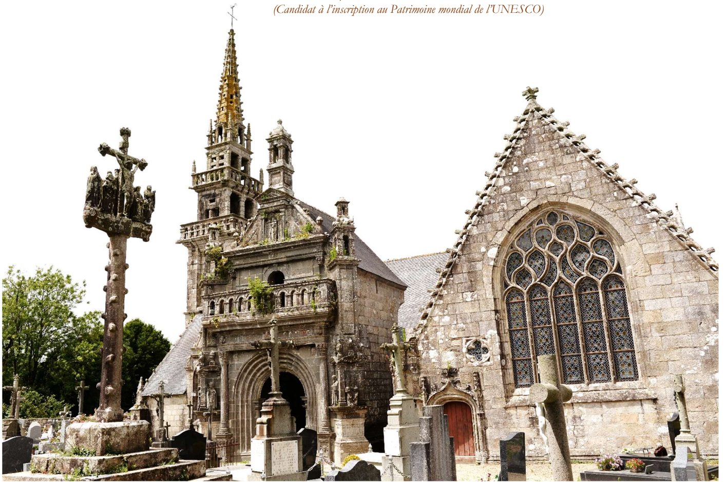
Ph : JRP 2026