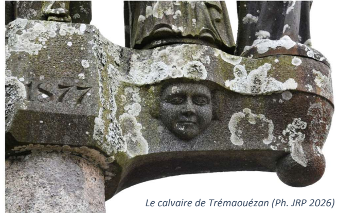
Le calvaire de Trémaouézan